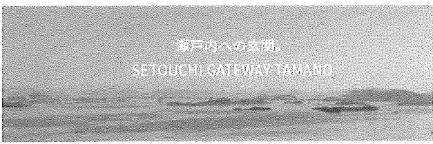
瀬戸内への玄関。 SETOUCHI GATEWAY TAMANO